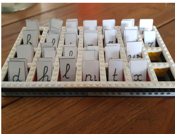
Letterbak gemaakt van lego

Er zijn ook leuke voorleesboeken te beluisteren op die manier!