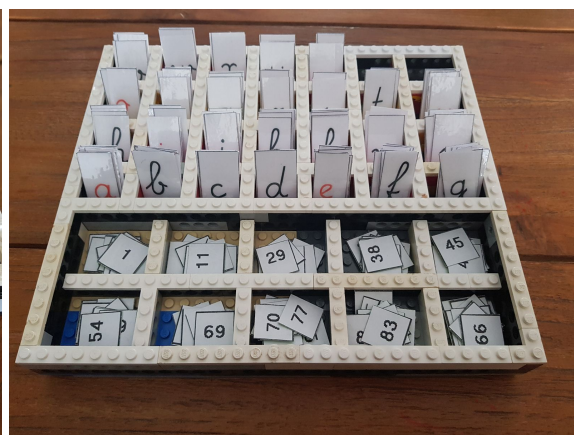
Ook voor de cijfers van het 100 bord